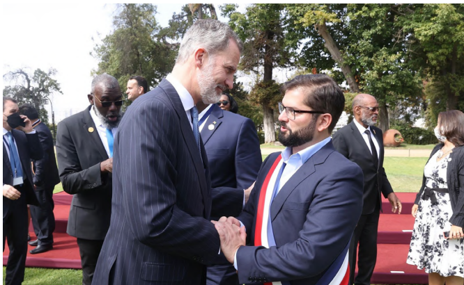
El rey Felipe VI y el presidente de Chile, Gabriel Boric.-15/03/2022 Santiago de Chile (Palacio de Cerro Castillo), Viña del Mar.

Ocupó el cargo de director de Planificación del Ministerio de Relaciones Exteriores de Chile entre 1996 y 2001. Durante el caso Pinochet, trabajó como abogado del Estado chileno en Londres. Además, ha tenido una destacada carrera académica, como director del Instituto de Estudios Internacionales de la Universidad de Chile y como profesor en el Instituto Universitario Ortega y Gasset en Madrid, España.