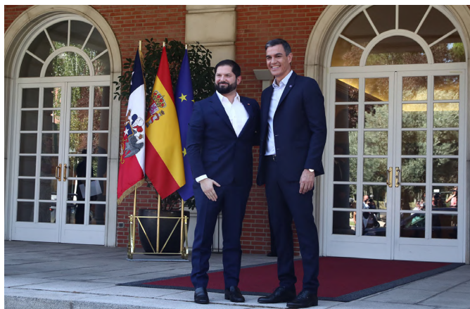
El presidente de Gobierno español, Pedro Sánchez, junto al presidente de la República de Chile, Gabriel Boric.- Moncloa, Madrid 14.7.2023.

dacionales” o “maximalistas”, tan temidos por los sectores conservadores de la sociedad chilena.