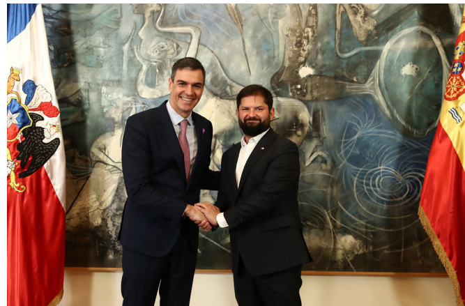
El presidente de Gobierno español, Pedro Sánchez y el presidente de la República de Chile, Gabriel Boric, en el Palacio de la Moneda.- Santiago de Chile (Chile) 8.3.2024.- foto: Pool Moncloa / Fernando Calvo.

Deuda pública: 39,4% del PIB en 2023, según el Banco Central de Chile.